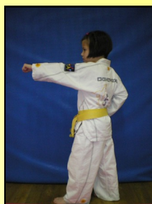
19 - Montong bandé jirugui, ap seugui