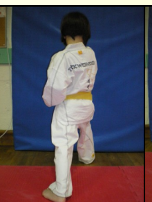
21 - Montong bandé jirugui, ap koubi seugui