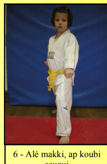
6 - Alé makki, ap koubi seugui