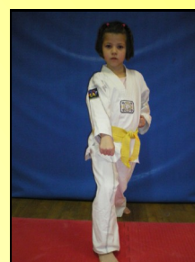
12 - Alé makki, ap koubi seugui