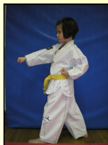
9 - Montong baro jirugui, ap seugui