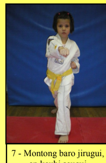
7 - Montong baro jirugui, ap koubi seugui