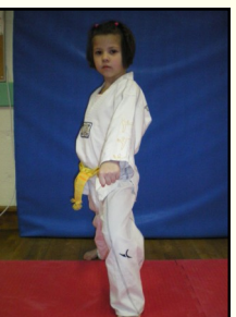
(Idem vue de face)