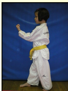
8 - Montong an makki, ap seugui