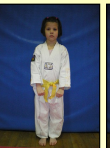
22 - Joubi seugui