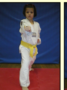
(Idem vue de face)