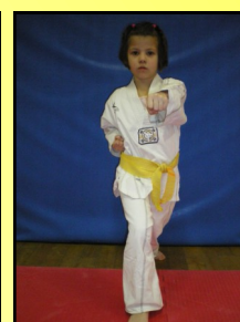
13 - Montong baro jirugui, ap koubi seugui