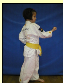
10 - Montong an makki, ap seugui