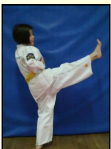
15 - Ap tchahui