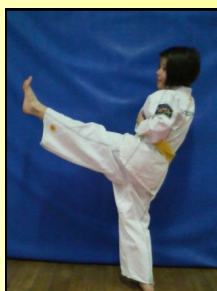
18 - Ap tchahui