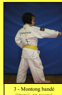
3 - Montong bandé jirugui, ap seugui