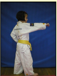
16 - Montong bandé jirugui, ap seugui