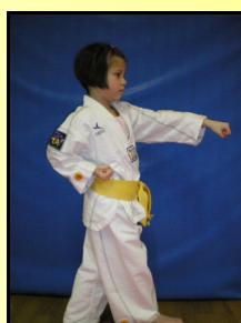
11 - Montong baro jirugui, ap seugui