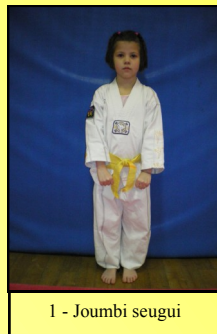
1 - Joubi seugui