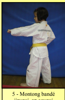
5 - Montong bandé jirugui, ap seugui